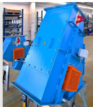
Ходовой распределитель, асимметричный