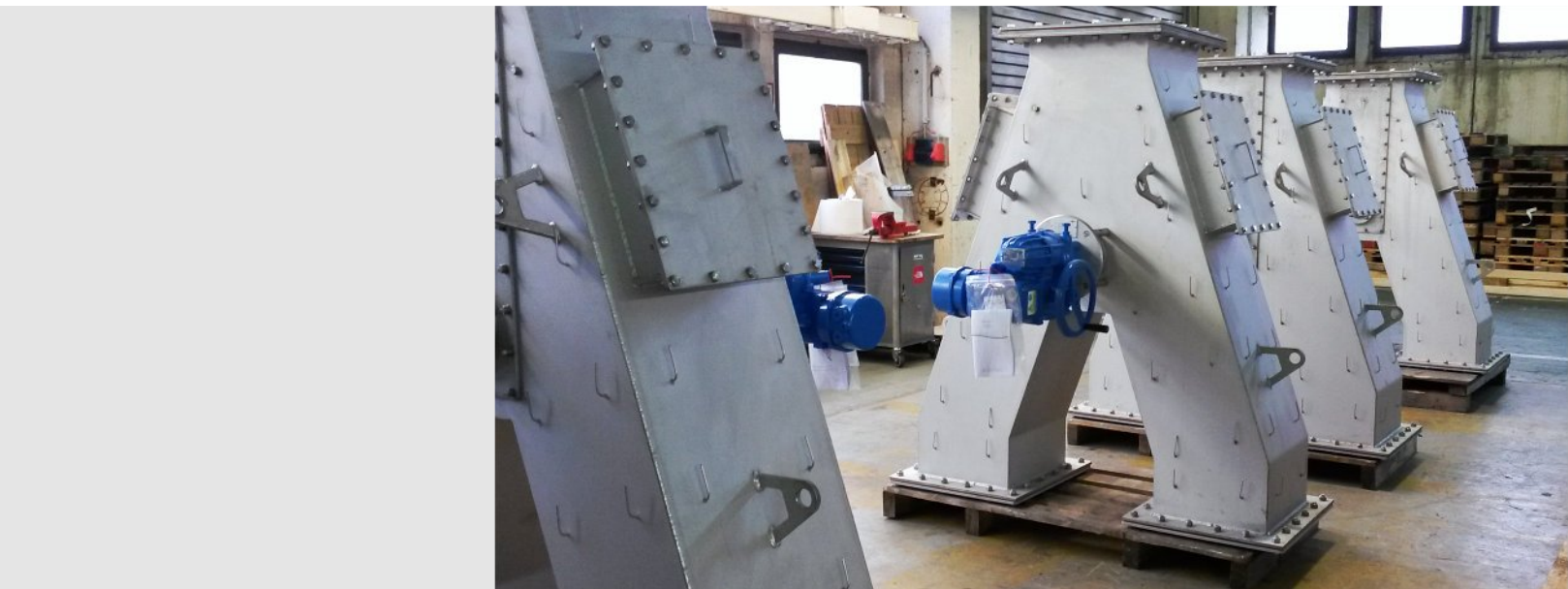
Ходовой распределитель с сервоприводом